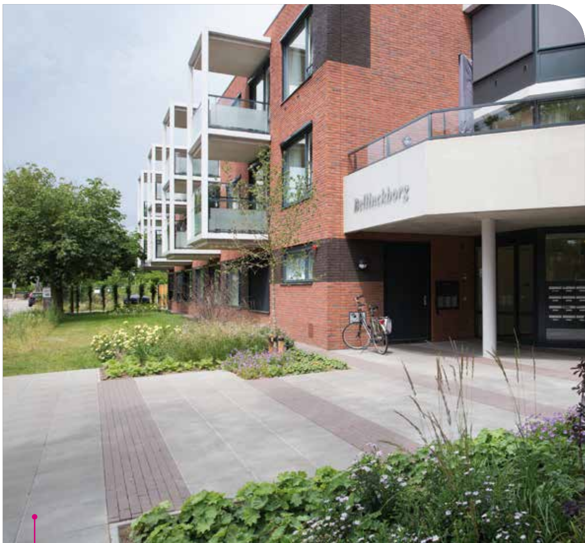
De hoofdingang aan de straatkant.

Meer informatie over Carintreggeland, de 22 huizen of onze andere diensten vind je op www.carintreggeland.nl